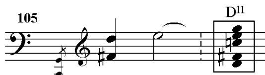
Kuvio 7. Etäännytetty d-duurisointu tahdeissa 115-8.

Säveltäjä käyttää välillä voimakkaasti konsonoivia sointuja ikään kuin etäännytettyinä. Tästä on esimerkkeinä tahdit 34-36 (katso kuvio 1) ja 115-118. Molemmissa on dominanttiseptimisointu (jälkimmäisessä mukana on myös nooni ja duodesimi), mutta säveltäjä on loitonanut ne käännöksillä ja vibraton villillä käytöllä niin, etteivät ne oikeastaan kuulosta konsonansseilta.