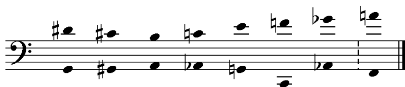
Kuvio 6. Vastaliike ylä- ja aläänissä; omintakeinen purkaus f-duuriin.

Säveltäjä käyttää välillä voimakkaasti konsonoivia sointuja ikään kuin etäännytettyinä. Tästä on esimerkkeinä tahdit 34-36 (katso kuvio 1) ja 115-118. Molemmissa on dominanttiseptimisointu (jälkimmäisessä mukana on myös nooni ja duodesimi), mutta säveltäjä on loitonanut ne käännöksillä ja vibraton villillä käytöllä niin, etteivät ne oikeastaan kuulosta konsonansseilta.