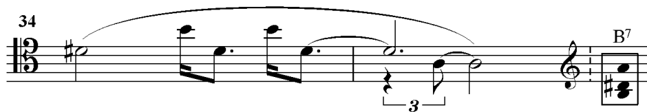
Kuvio 1. Etäännytetty h-duurisepetimisoitu.

Tahdit 102-106 on käsittääkseni rakennettu melodisesti, vaikka asteikkoja tai muita säännönmukaisuuksia on vaikea erottaa. Tämä johtuu ainakin siitä, että pyrähtely ulottuu myös alennusmerkkisestä maailmasta ylennysmerkkiseen ja takaisin. Korvaan tarttuu vain suunta ylöspäin. Nopeilla dynaamisilla ja tempollisilla ryöpsähdyksillä haetaan vauhtia päästä sellon matalimman rekisterin f:stä kaksiviivaiseen g#:n.